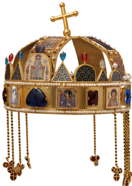
AZ ÉGI ÉLŐ IGAZSÁG – AZ ANGYALI ÉS APOSTOLI MAGYAR SZENT KORONA